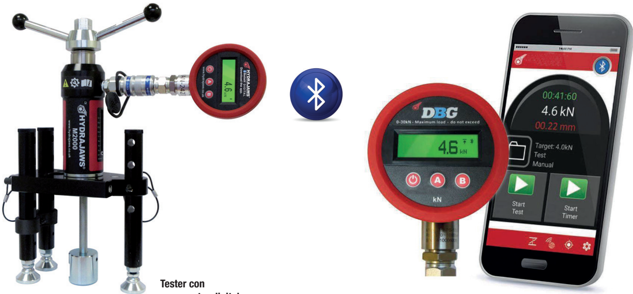
Tester con manometro digitale

Manometro digitale con sistema Bluetooth. Grazie ad una pratica app i risultati delle prove su cantiere possono essere registrati in report digitali. Tramite Cloud potranno essere condivisi ed accessibili da qualsiasi browser.