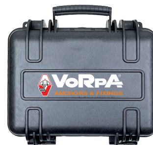
Valigetta per il trasporto