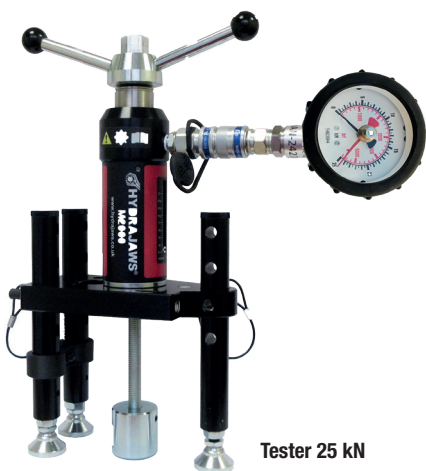
Tester 25 kN